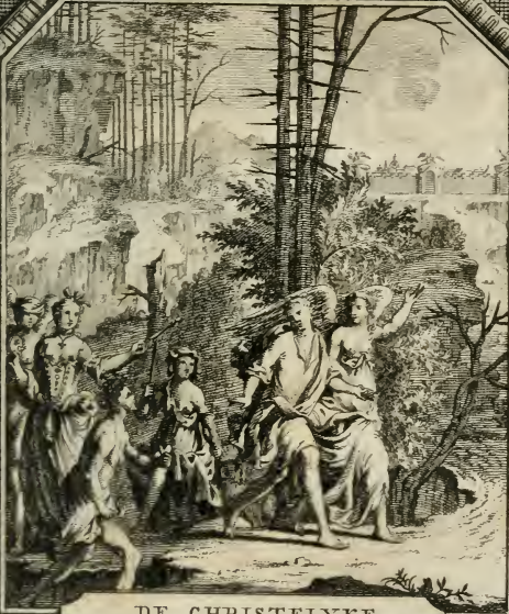
DE CHRISTELYKE WANDEL.